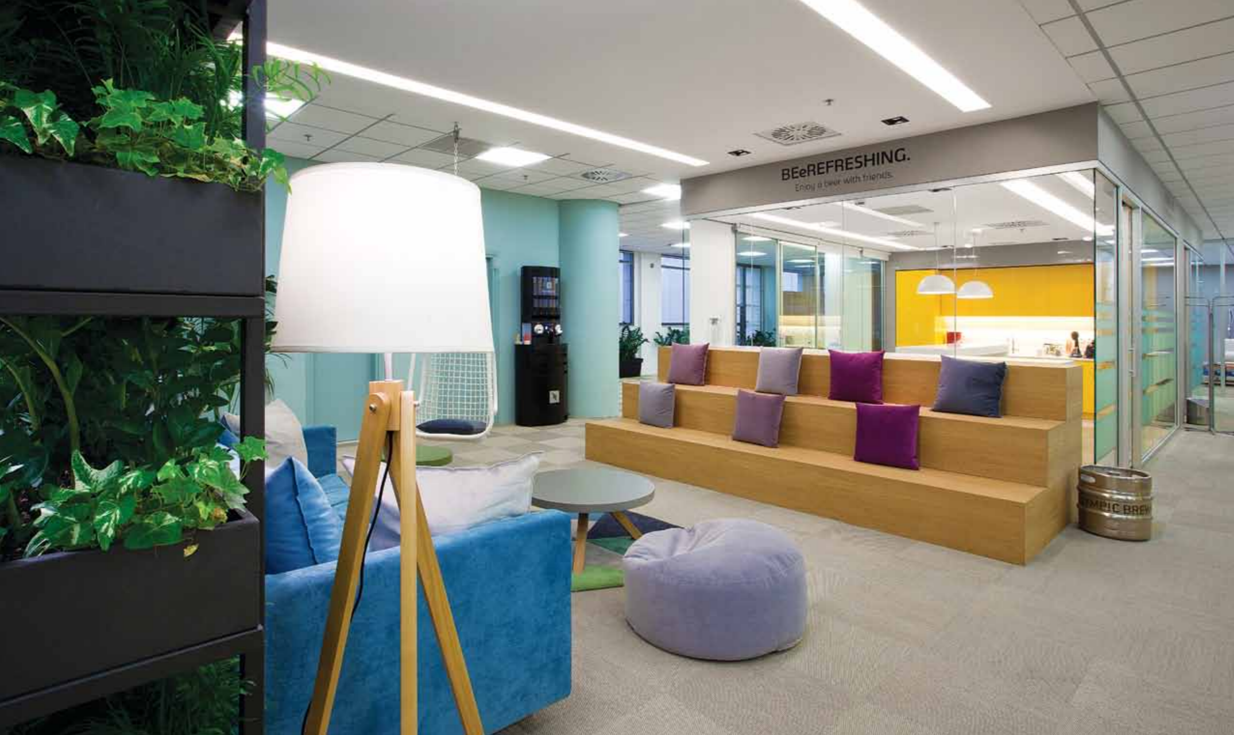
Εταιρίες που συμμετείχαν στο έργο και διαφημίζονται στο τεύχος αυτό: BRIGHT: Φωτισμός

Οι αρχιτέκτονες του έργου, σε συνεργασία με το Εργαστήριο Ψηφιακών Μέσων Σχεδιασμού της Αρχιτεκτονικής Σχολής του Πολυτεχνείου Κρήτης, ανέπτυξαν μια καινοτόμο εφαρμογή ανταλλαγής πολυμεσικού περιεχομένου, εν είδει εσωτερικού κοινωνικού δικτύου, προσαρμοσμένου στις ανάγκες και στη φιλοσοφία της εταιρίας. Οι εργαζόμενοι έχουν τη δυνατότητα να ανεβάζουν φωτογραφίες, video, πληροφορίες, κλπ. από τους υπολογιστές τους και τα κινητά τους τηλέφωνα